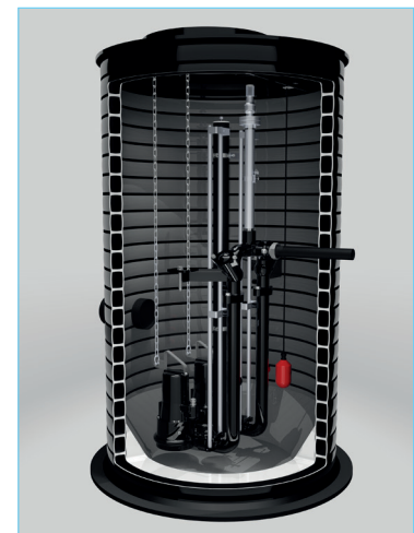
Die HOMA SK-Schächte sind als Einzel- oder Doppelpumpstation erhältlich